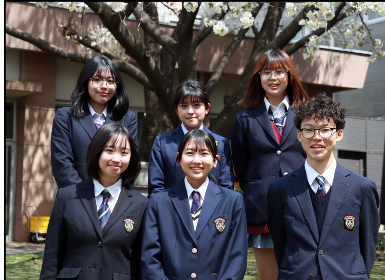
18代目前期生徒会執行部