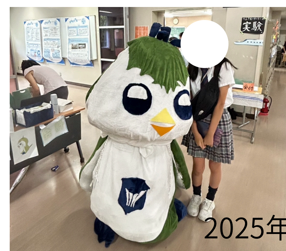
2025年度スクールフェスティバル