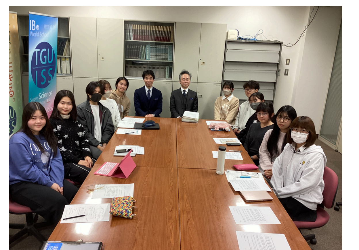
副校長先生とのエアコン設置についてのミーティング